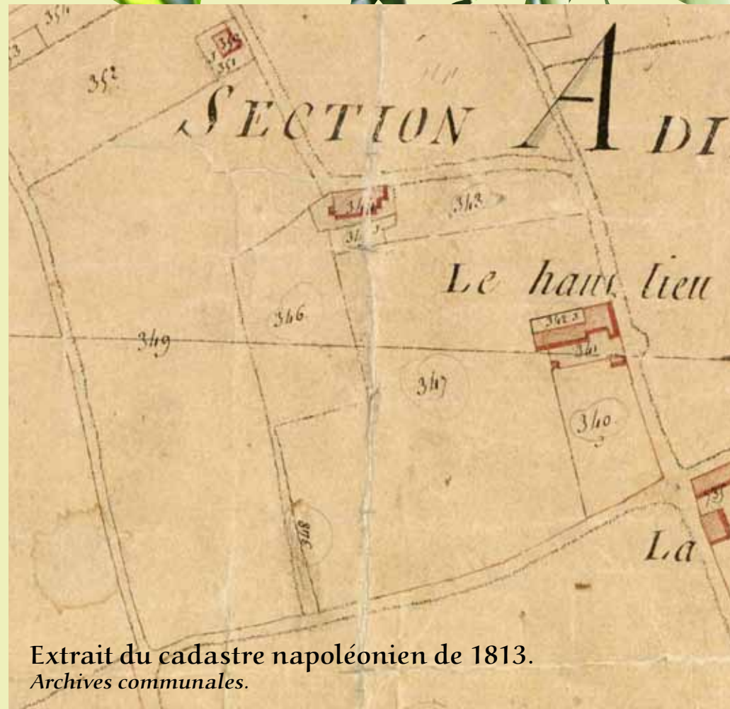
Extrait du cadastre napoléonien de 1813.