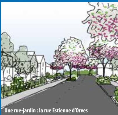
Une rue-jardin : la rue Estienne d'Orves

Président de la Communauté d'agglomération Tour(s)plus