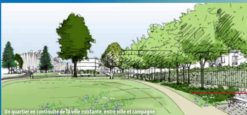
Un quartier en continuité de la ville existante, entre ville et campagne