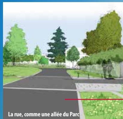
La rue, comme une allée du Parc