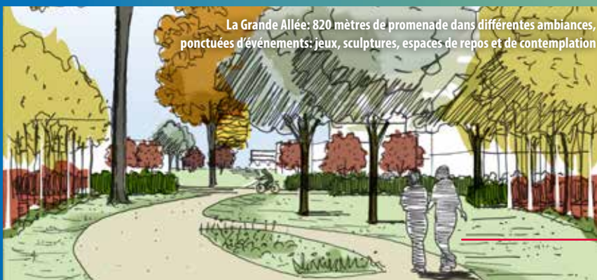
La Grande Allée: 820 mètres de promenade dans différentes ambiances, ponctuées d'événements: jeux, sculptures, espaces de repos et de contemplation