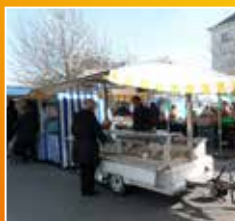
VIE LOCALE Page 18