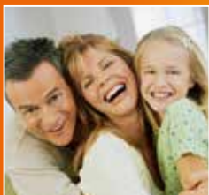
VIE SOCIALE - FAMILLE Page 14