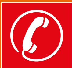
SÉCURITÉ / URGENCES Page 19