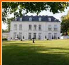
INFORMATIONS GÉNÉRALES Page 4