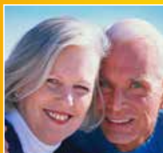
VIE SOCIALE - SENIORS Page 12