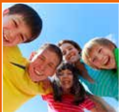
JEUNESSE Page 6