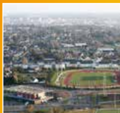
SPORT - CULTURE Page 8