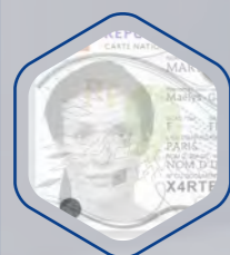
Effet mat et brillant sur le portrait