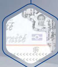
Effet visuel et tactile