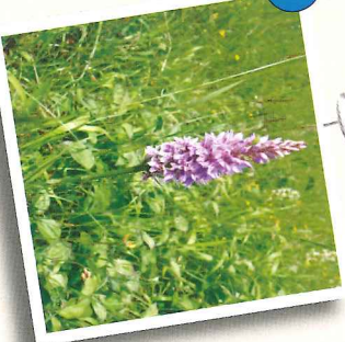
Orchis de Fuchs